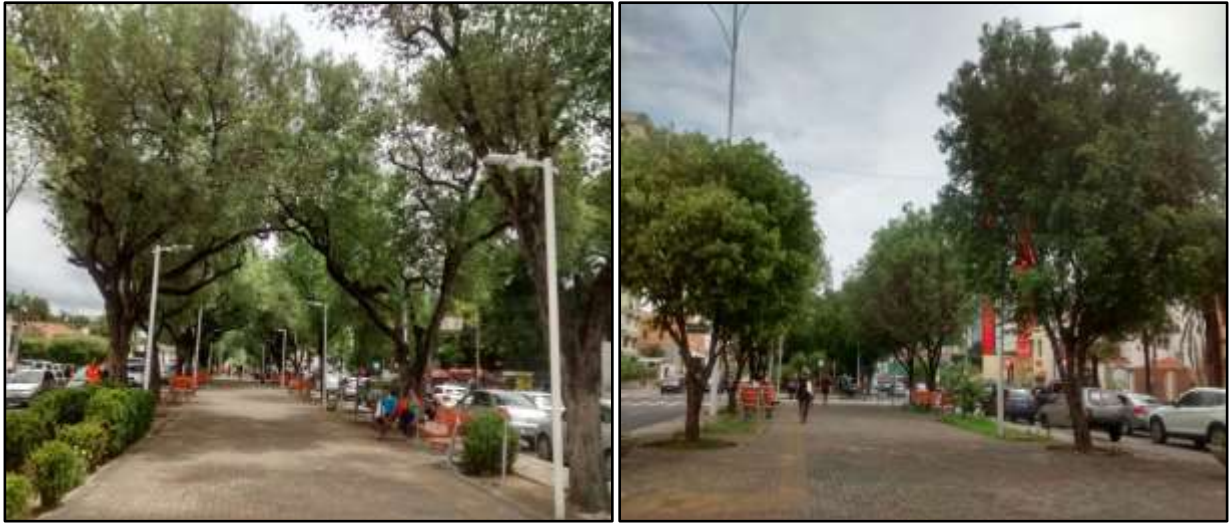
Figura 1. Porte arbóreo da vegetação do passeio do canteiro central da Avenida Frei Serafim, Teresina-PI