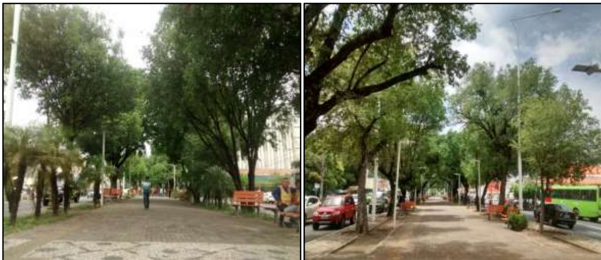
Figura 2. Diâmetro copa da vegetação do passeio do canteiro central da Avenida Frei Serafim, Teresina-PI.

Considerando o diâmetro da copa de cada indivíduo, observa-se que, 139 ou 45.13 % das árvores possuem copa pequena; 97 ou 31.49 % copa média e 72 ou 23.38% copa grande (figura 2).